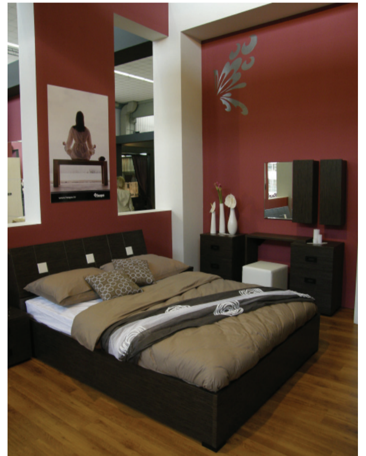
Namještaj Marta atraktivno je dizajniran te u skladu sa svjetskim trendovima

Drugi novitet u programu madraca izazvao je na sajmu veliku pažnju svih posjetitelja, dijelom zbog atraktivne prezentacije, ali najviše zbog potpune inovativnosti na području povećanja kvalitete spavanja. Radi se o programu madraca i jastuka s posebnim Technogelom u svom sastavu. Ovaj jedinstveni materijal razvijen je bio primarno za upotrebu u medicini, za operacijske i reanimacijske stolove kako bi se pacijentu osiguralo udobno i sigurno mirovanje za vrijeme dugotrajnih operacija te potpuno spriječila bilo kakva mogućnost dobivanja rana od ležanja. Technogel u odnosu na ostale materijale, koji pritisak tijela raspoređuju samo u jednom smjeru, pritisak distribuira po sve tri osi: gore-dolje,