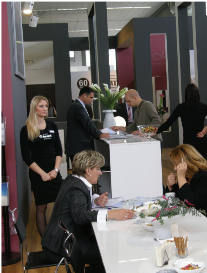
Posjećenost Hespova izložbenog prostora uvijek je velika