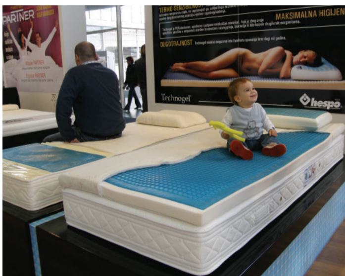
Madraci i jastuci s posebnim Technogelom u svom sastavu