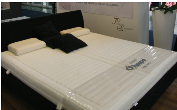
Partner madraci – novi pristup boljem spavanju u dvoje

Prema Hespovom štandu na ovogodišnjoj Ambienti može se već na prvi pogled zaključiti kako je njihova stalna misija činiti naš svijet sve udobnijim i ljepšim. To je posebice odnosi na onaj dio našeg života kad spavanjem pokušavamo vratiti potrošenu energiju, odmoriti duh i tijelo. Naime, na njihovom atraktivno osmišljenom i dizajniranom štandu prezentirali su nam ponovno niz novosti, a brojni posjetitelji nizali su pozitivne reakcije i oduševljenje svim prikazanim, počevši od novih spavaćih soba, madraca, podnica, jastuka, pa sve do kreveta.