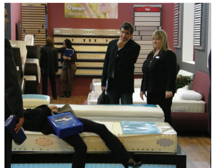
Hespovi madraci zainteresirali su i poznatog glumca Zijada Gračića